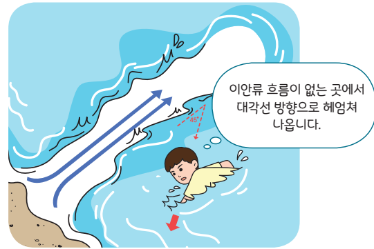
< 이안류 탈출 요령 >