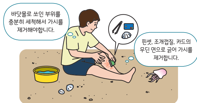
< 해파리에 쏘인 경우 대처요령 >