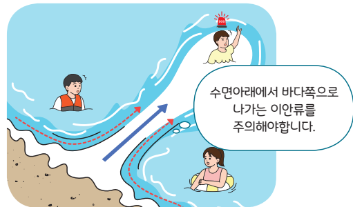
< 이안류(거꾸로 치는 파도) >

** 수면아래에서 바다 쪽으로 나가는 강한 역류성 흐름(최고 3m/sec)